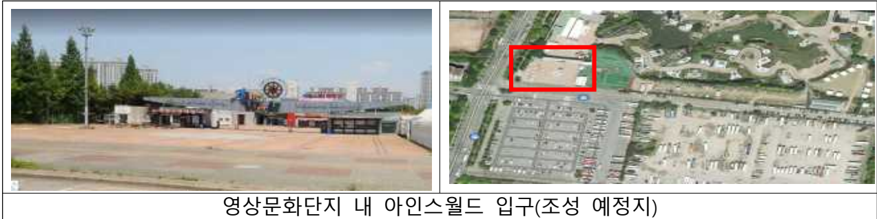
영상문화단지 내 아인스월드 입구(조성 예정지)