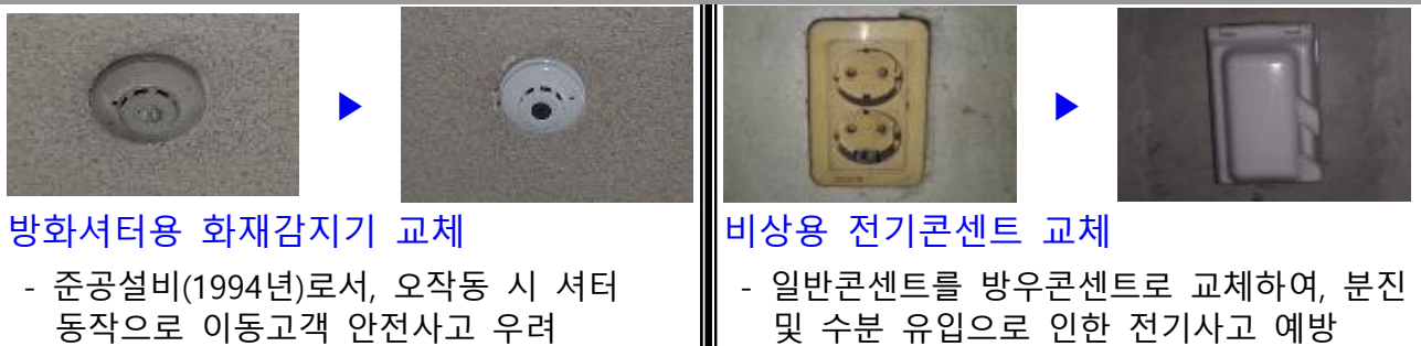
방화셔터용 화재감지기 교체