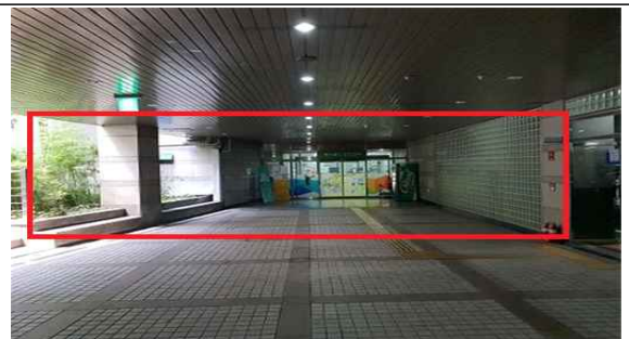
지하2층 방풍실 확장