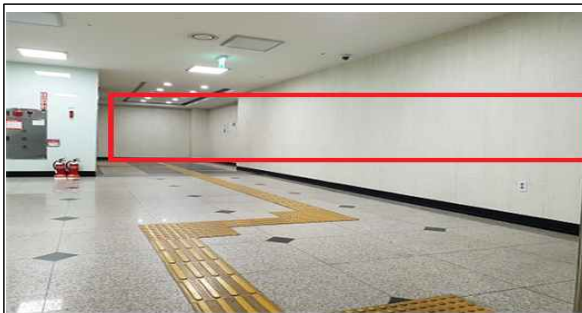
지하1층 로비 벽면