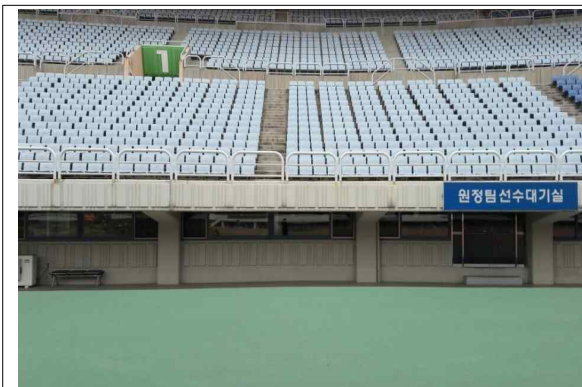
(현) 계단 설치 예정 장소