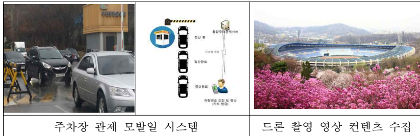
주차장 관계 모바일 시스템