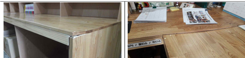
▶ 5층 만화카페 안내데스크 상판 뒤틀림 부분 - 상판 전체 철거 → 받침부분과 동일재질의 상판으로 교체 : 12m