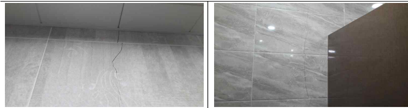
▶ 3 ~ 5층 여자화장실 벽면 타일 균열부분 - 균열부분 타일 철거 → 재 미장 → 타일 신설 : 약 8m구간