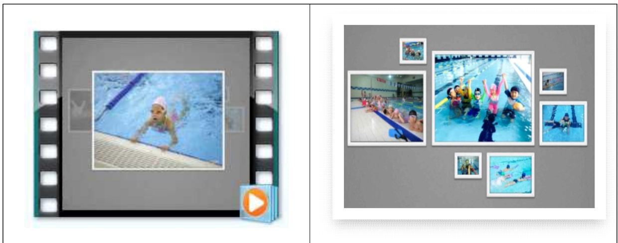
(방학특강 기념 포토영상물 예시)